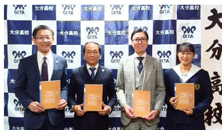
2024年11月12日 第1回 贈呈式の様子 大分高校にて開催