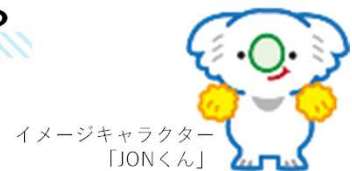
イメージキャラクター 「JONくん」