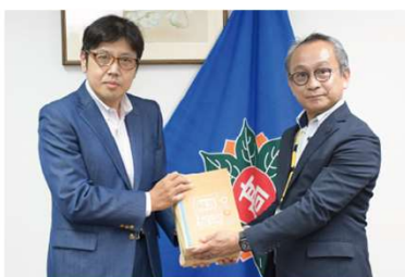
2024年10月17日 第5回 贈呈式の様子 熊本県立東陵高校にて開催